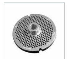
Plate Enterprise System