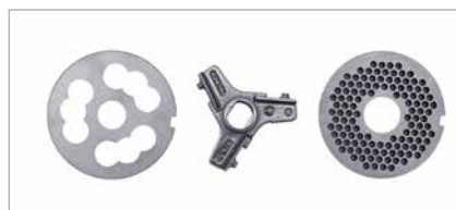
Doppio Taglio | Double Cutting System | Système avec Double Coupe