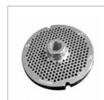
Plate Enterprise System