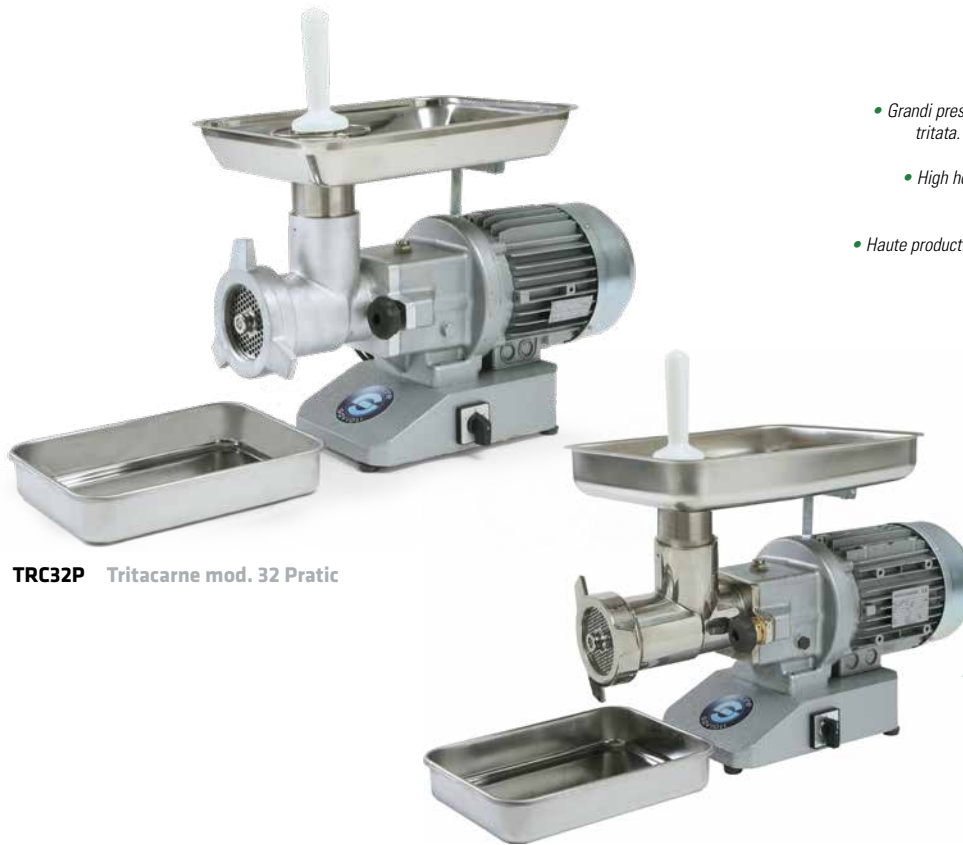
TRC32P Tritacarne mod. 32 Pratic