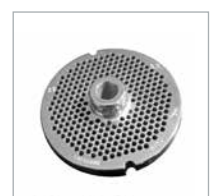
Plate Enterprise System